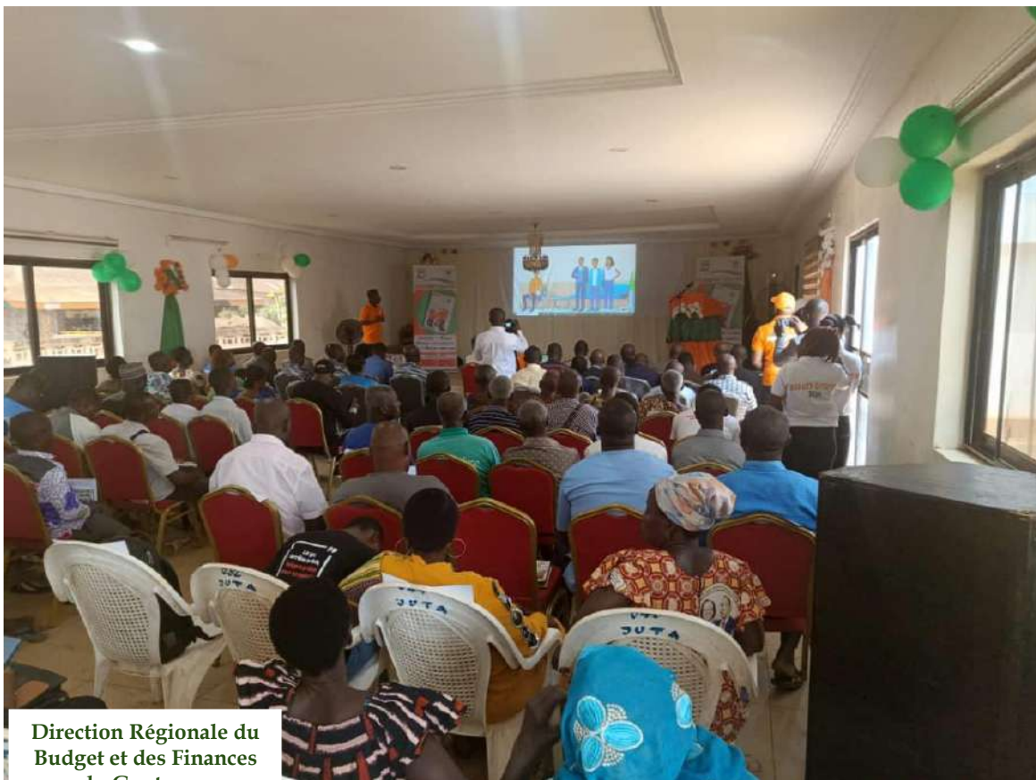
Direction Régionale du Budget et des Finances du Gontougo