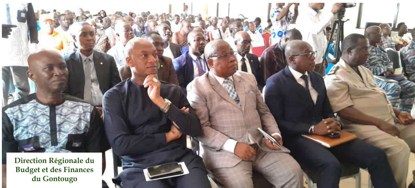
Campagne De Vulgarisation Du Budget Citoyen 2024 Dans Le Département De TANDA Salle des fêtes de la Mairie de TANDA