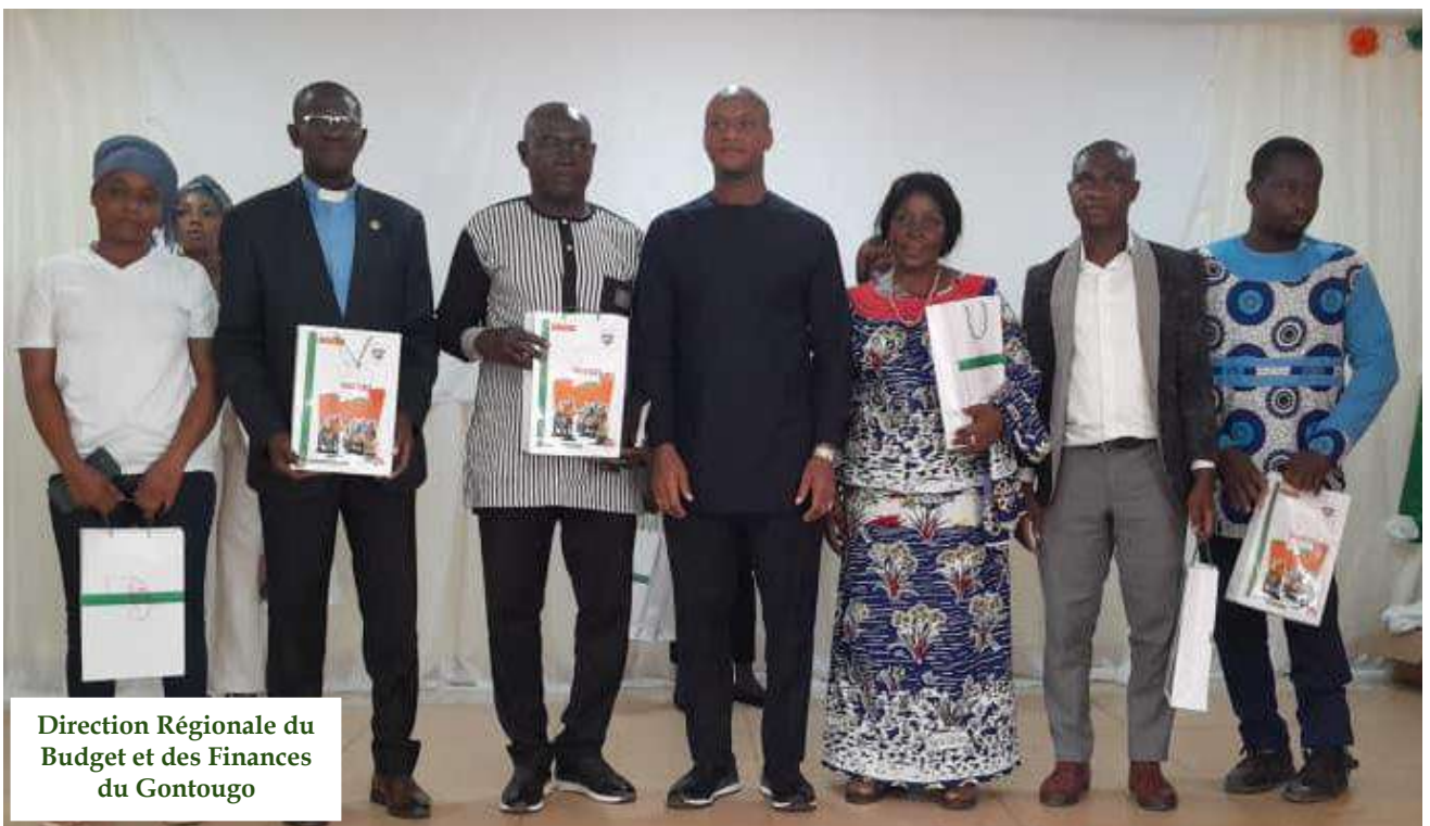
Direction Régionale du Budget et des Finances du Gontougo

1 er adjoint au maire de la commune de TANDA