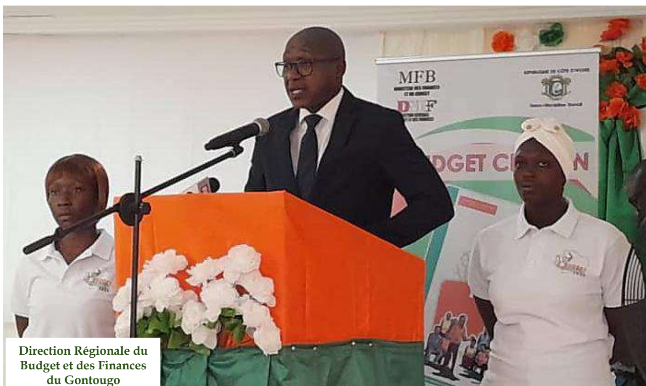
Campagne De Vulgarisation Du Budget Citoyen 2024 Dans Le Département De TANDA Allocutions de Monsieur Directeur des Opérations des Collectivités Décentralisées (DOCD), représentant le Directeur Général du Budget et des Finances