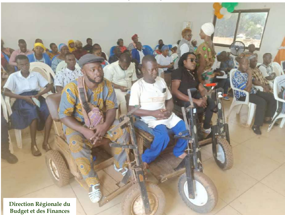
Direction Régionale du Budget et des Finances du Gontougo