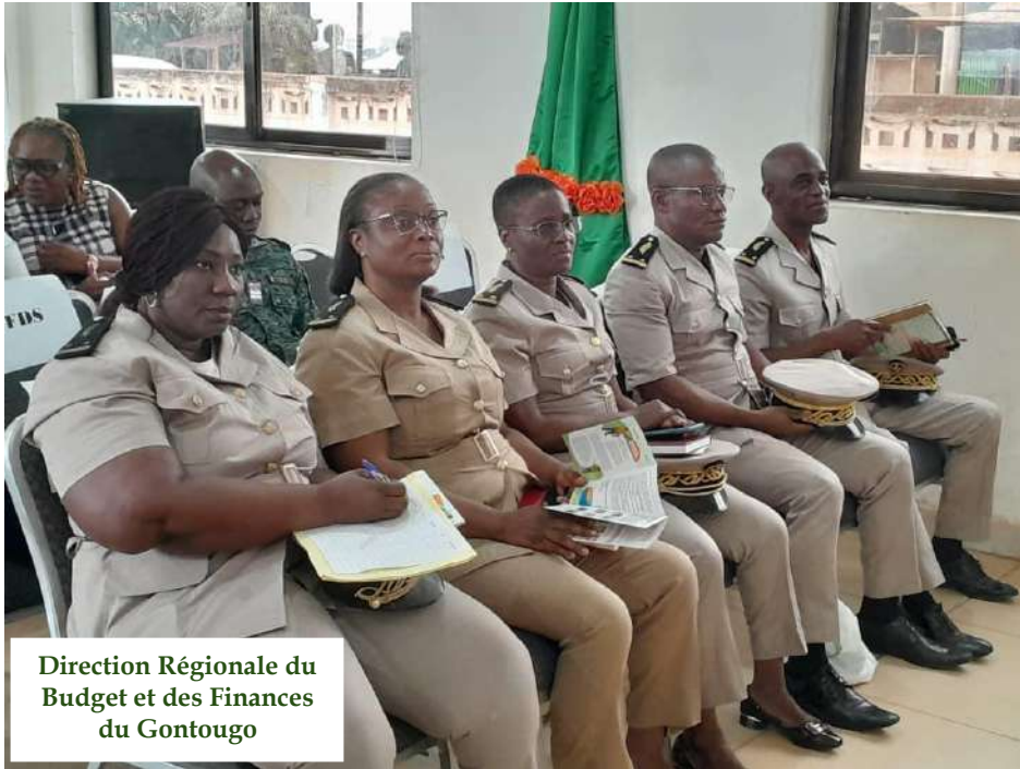
Direction Régionale du Budget et des Finances du Gontougo