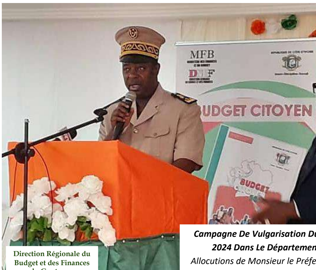
Direction Régionale du Budget et des Finances du Gontougo