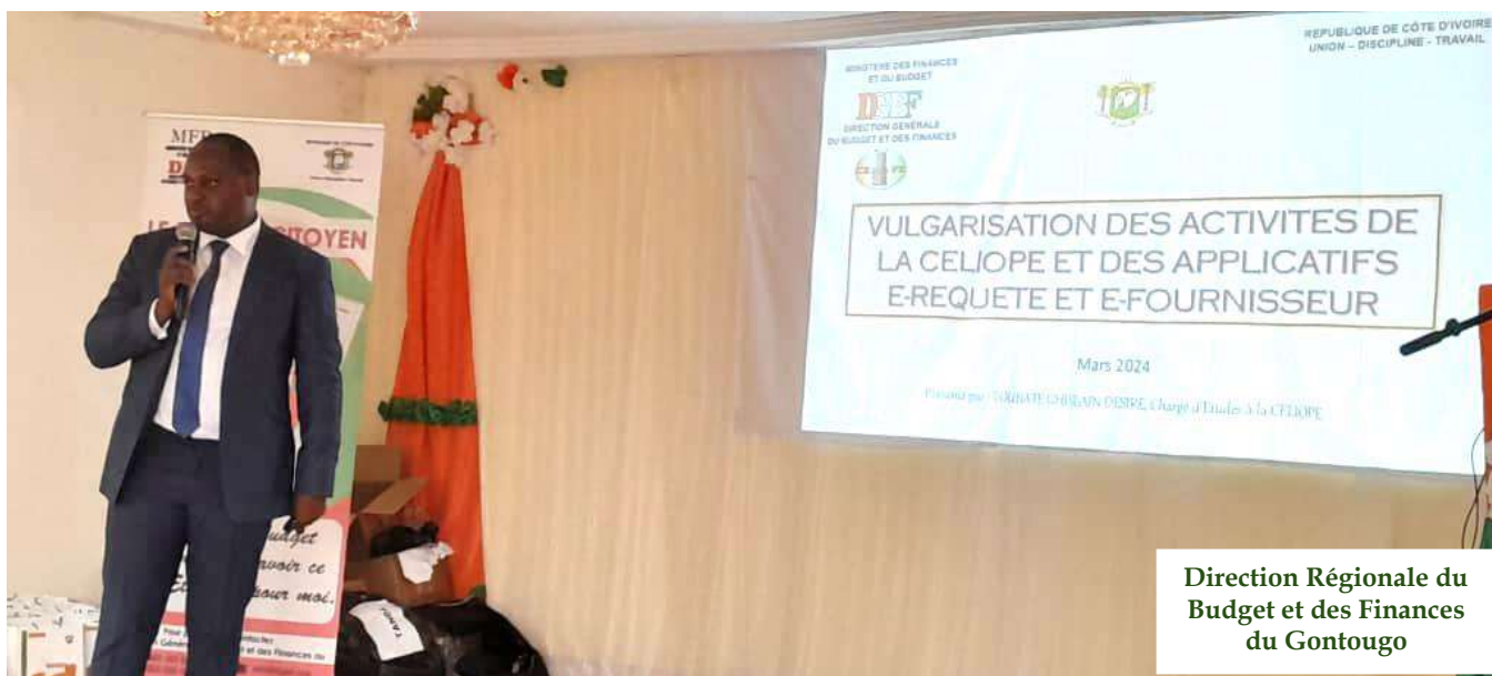
Campagne De Vulgarisation Du Budget Citoyen 2024 Dans Le Département De TANDA Exposés sur le « BUDGET CITOYEN »

Direction Régionale du Budget et des Finances du Gontougo