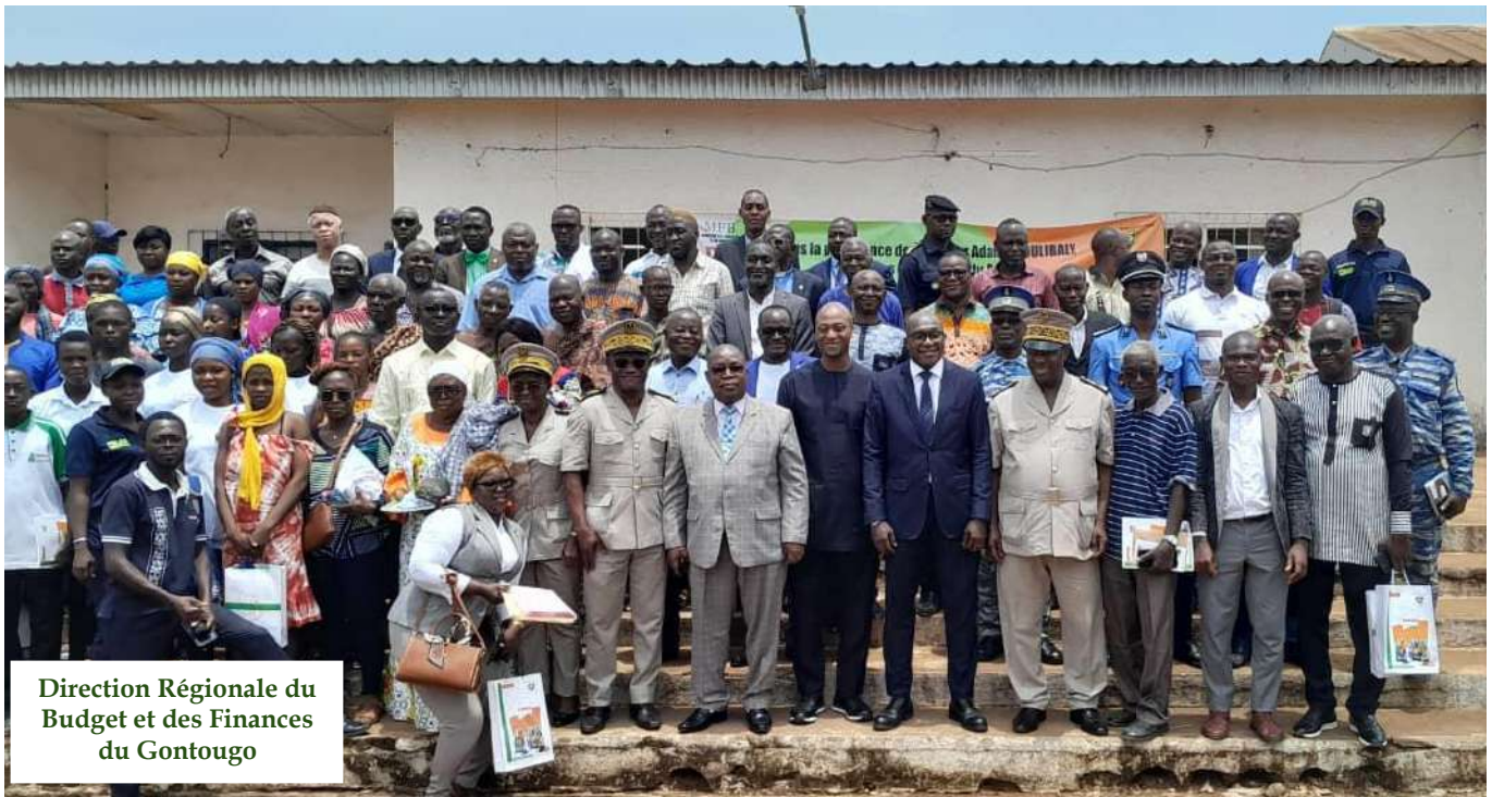
Direction Régionale du Budget et des Finances du Gontougo