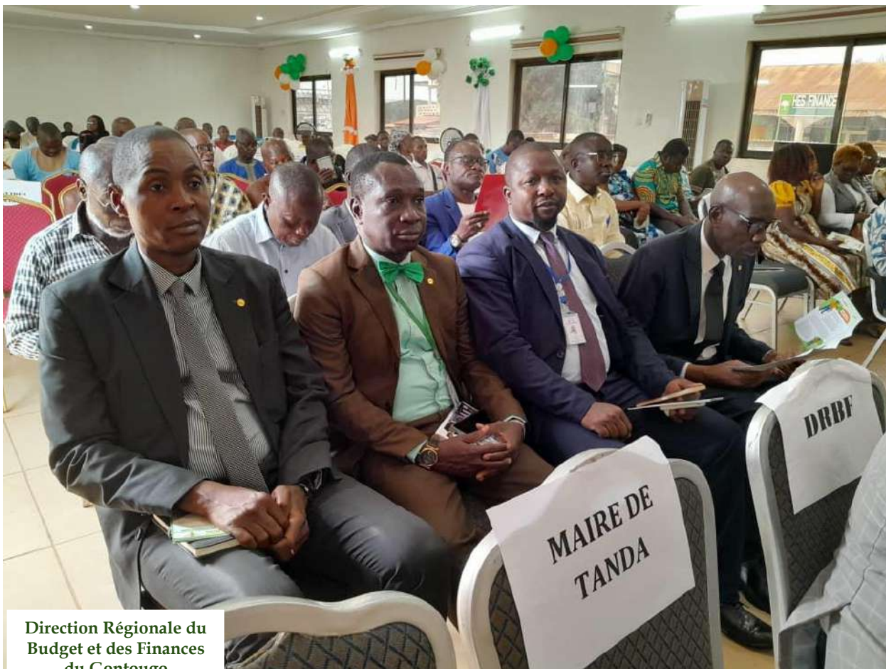
Direction Régionale du Budget et des Finances du Gontougo