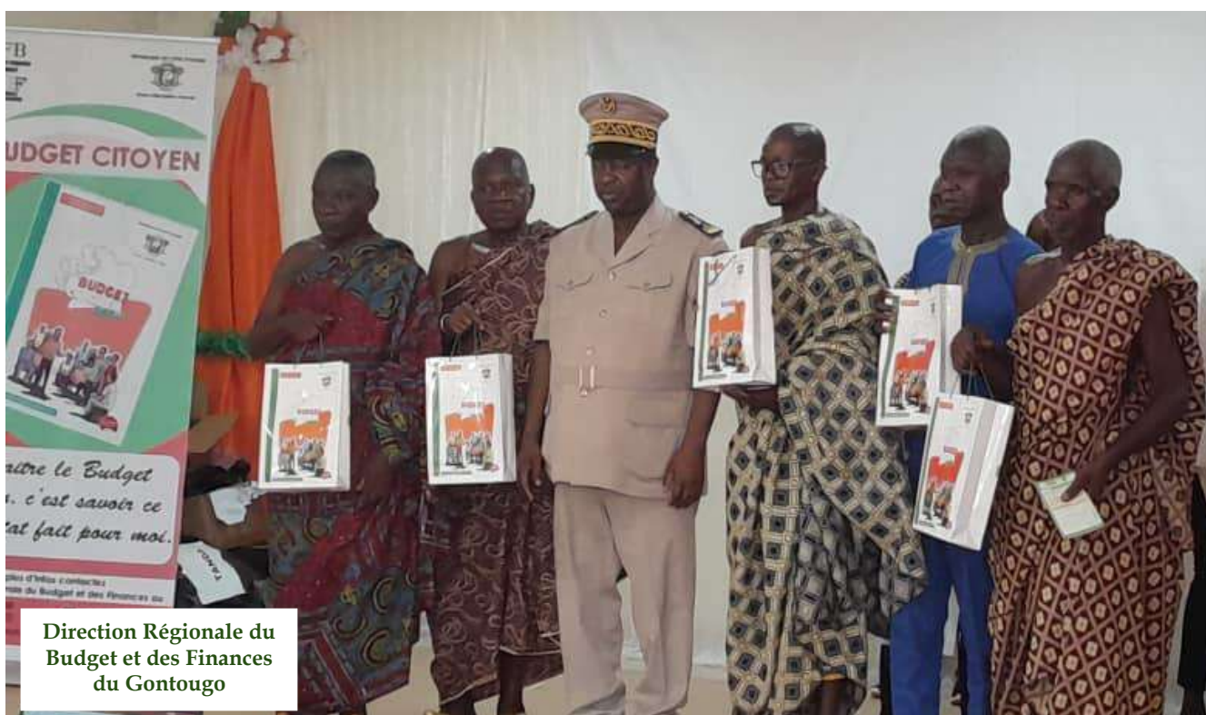
Campagne De Vulgarisation Du Budget Citoyen 2024 Dans Le Département De TANDA Salle des fêtes de l'hôtel de la Mairie de TANDA Remise de kits

Direction Régionale du Budget et des Finances du Gontougo