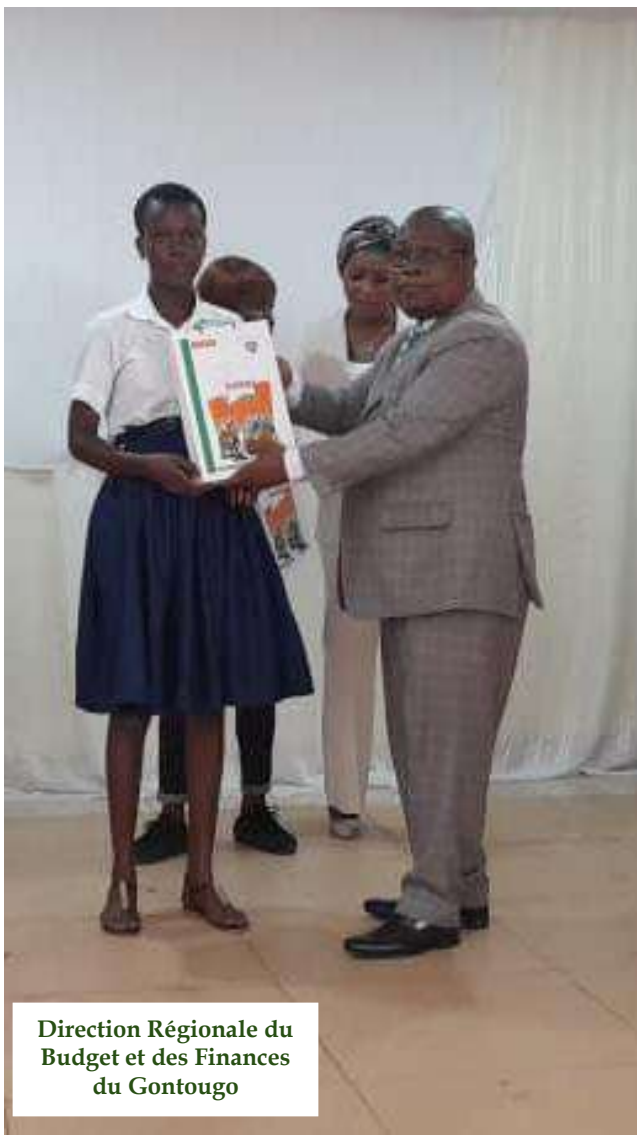
Direction Régionale du Budget et des Finances du Gontougo