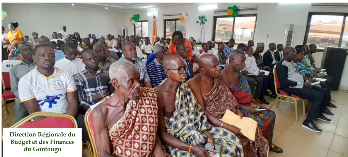
Campagne De Vulgarisation Du Budget Citoyen 2024 Dans Le Département De TANDA Salle des fêtes de la Mairie de TANDA