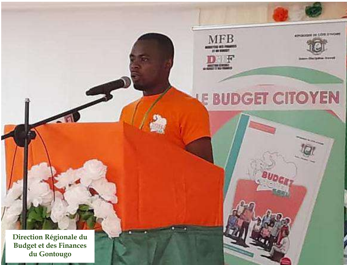
Direction Régionale du Budget et des Finances du Gontougo