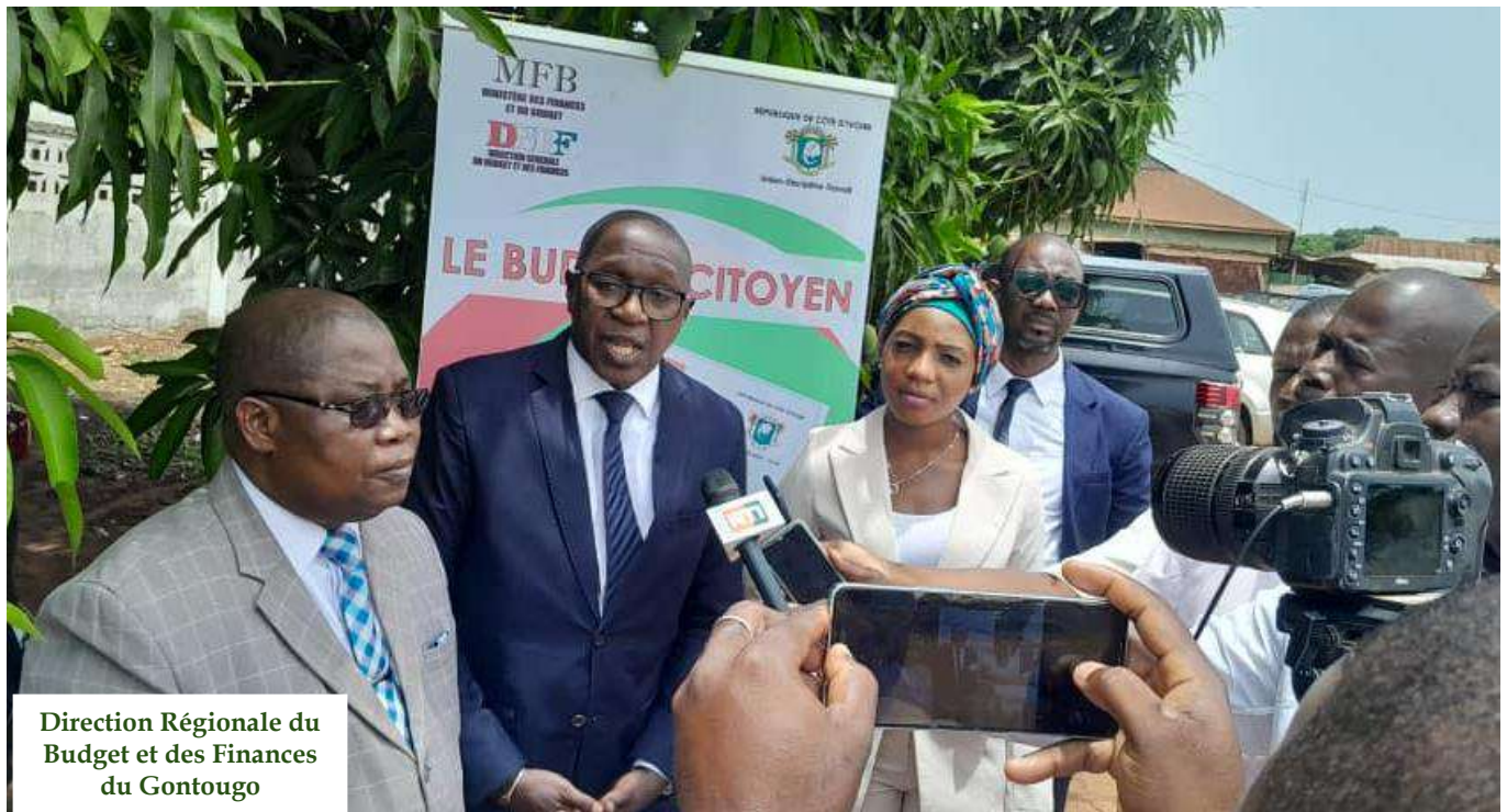
Direction Régionale du Budget et des Finances du Gontougo