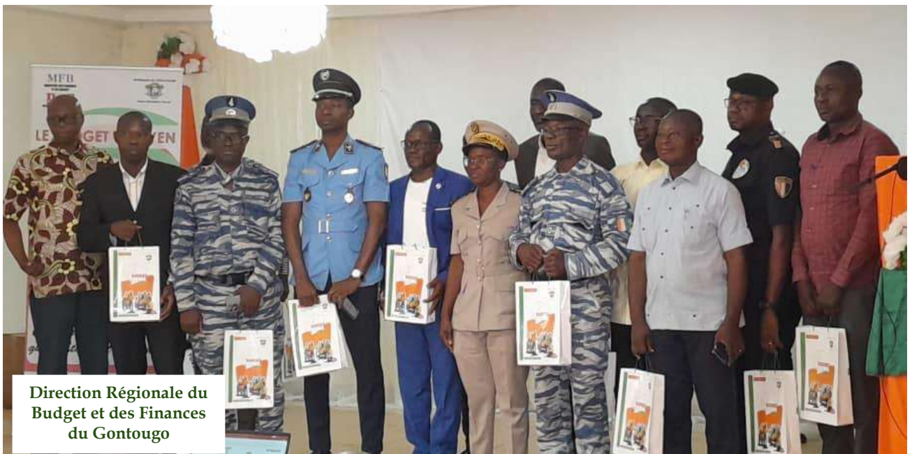
Direction Régionale du Budget et des Finances du Gontougo