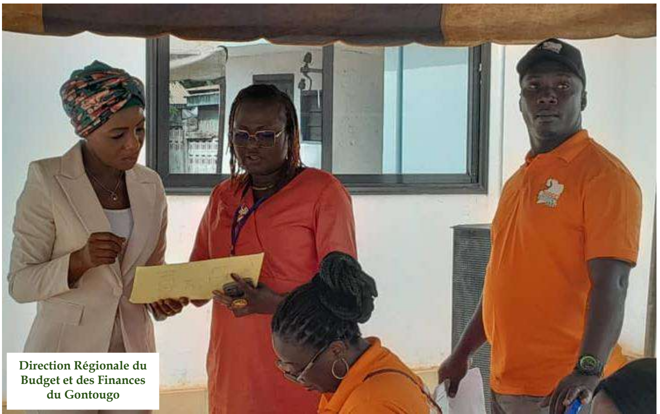
Direction Régionale du Budget et des Finances du Gontougo